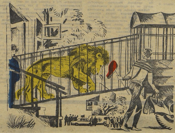
Рисунок Валентина ЕВЛАДИЧКО

льва сейчас придет убивать, он даже с места не шевельнется, как будто в его теле не осталось ни капли силы, только тоска и страха было в том, как он зевнул.